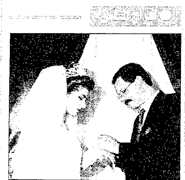
افراح آل عليان وآل الرتيبسي

نموض العلاقة بين رة الشركات، تعاون لحل عن طبيعة الشركات، عمل موازنة وم باعدادها، اداري حسب الاكاديمية مجلس ادارة سبال اللازمة جامعة هو ل عن تنفيذ خل باي حال ، يتم تقييم جامعية عن بعد انتهاء ا تحقق تلك بة لجامعة ق والاشراط لجامعة ا الاكاديمية لشركة. حسراف ان ني عاتق هذه ا في تأسيس اقات المطلوبة ان يعتقد ان لة وقريبة الا اعتراف بان تتتح الفرصة لدا ما اريد حيث هناك في البداية متمادين العاد هذا الامر الا عارفة باصور عليم العاني، مبلغ اسر اي الربح السريع عتيها. حول اسس لمة حاليا، ليات القبول عام الراسي صورة الكاملة تعتمد للعام ي شملت ليدا م تحدد موضع قبول تضمن من وكل كلية